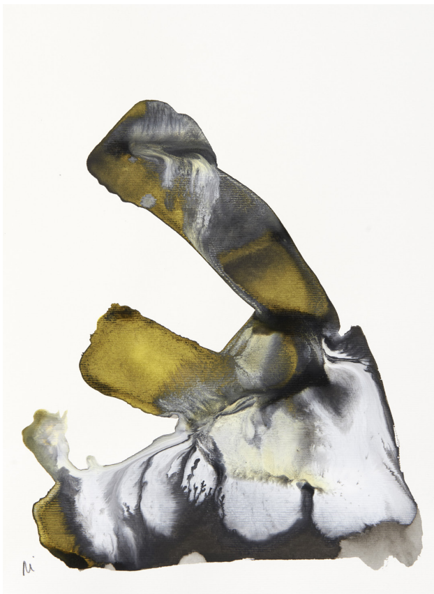
300 g-ko papera / papel 300 gr. – 30 x 42 cm