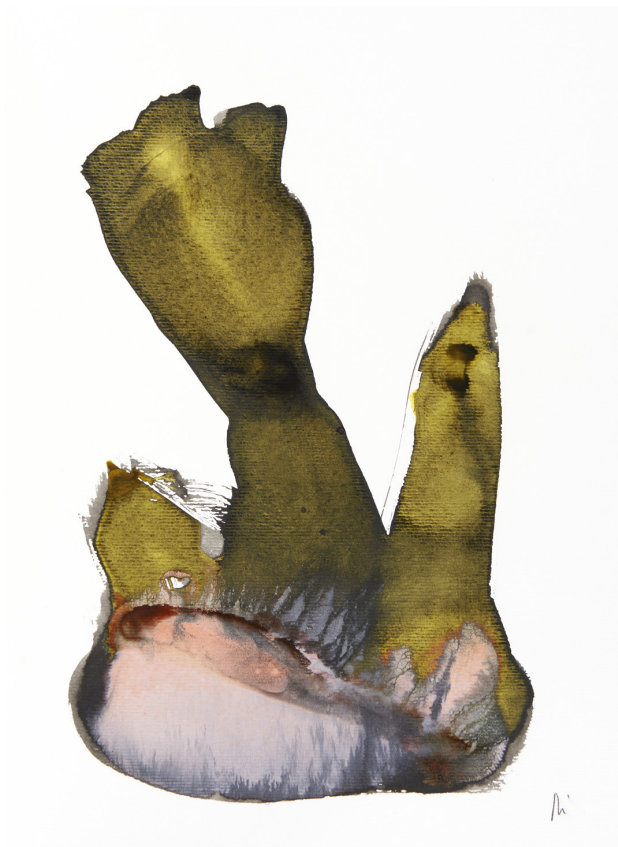
300 g-ko papera / papel 300 gr. – 30 x 42 cm