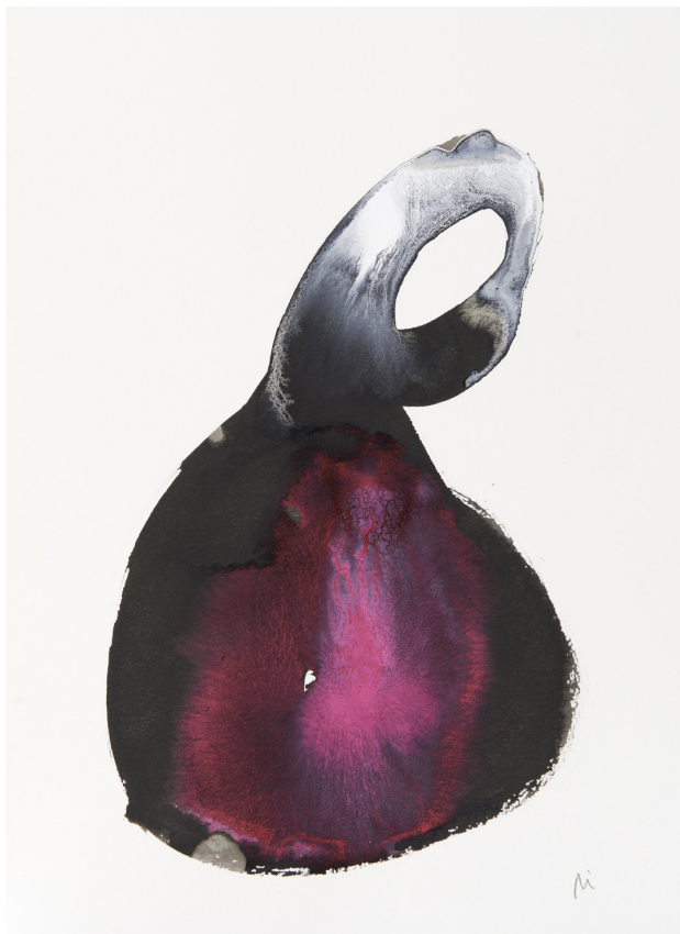
300 g-ko papera / papel 300 gr. – 30 x 42 cm