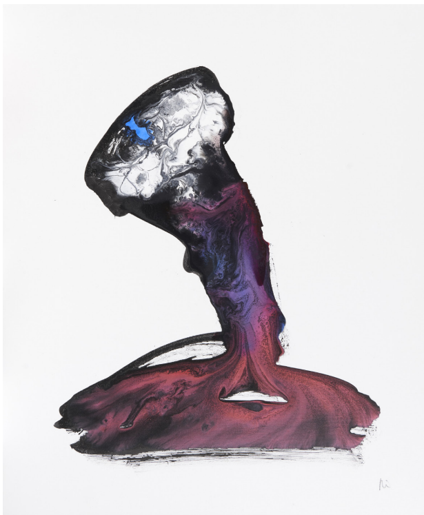
Mihisea / lienzo – 54 x 65 cm