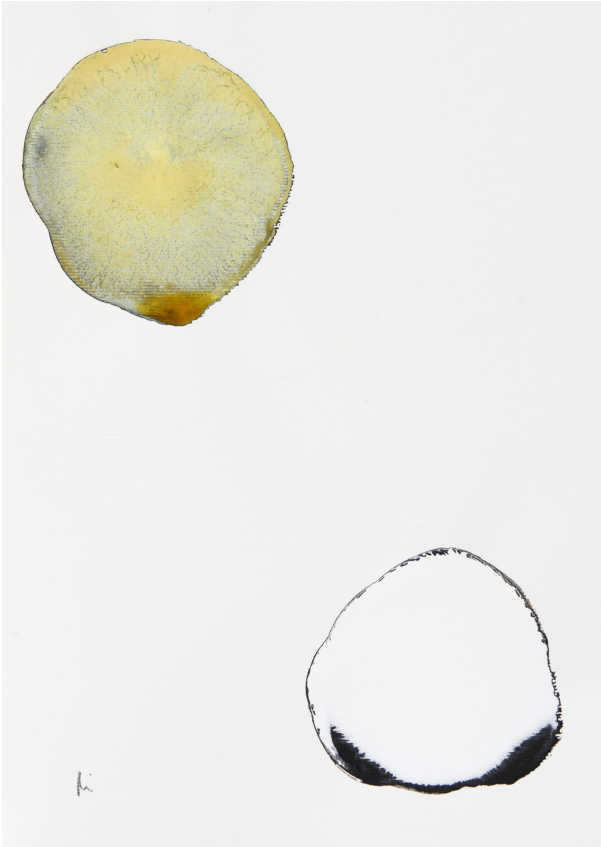
300 g-ko papera / papel 300 gr. – 30 x 42 cm