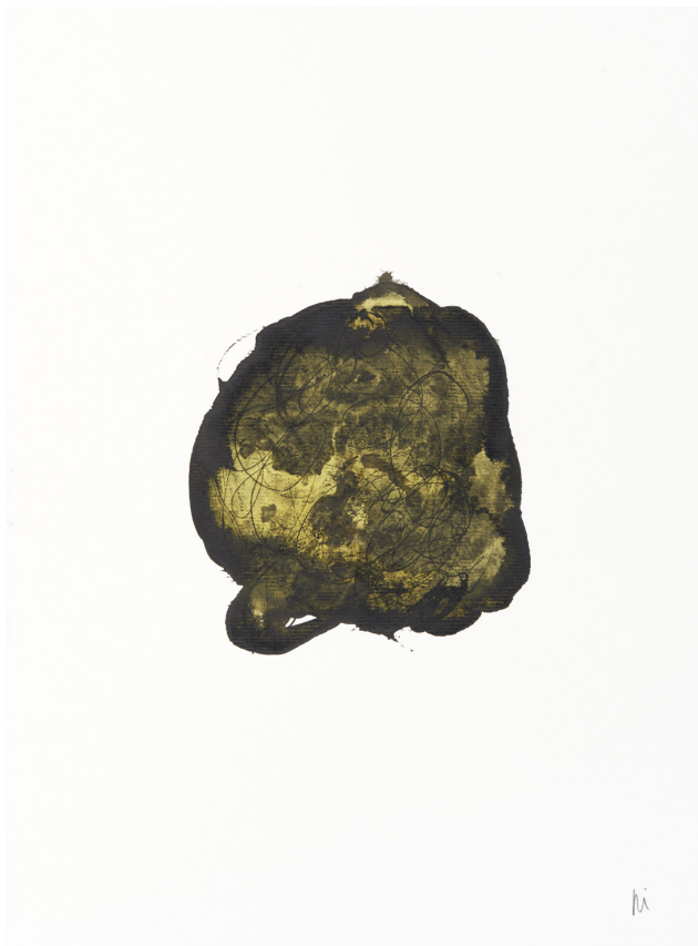
300 g-ko papera / papel 300 gr. – 30 x 42 cm