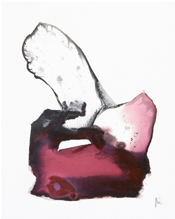
Mihisea / lienzo – 22 x 27 cm