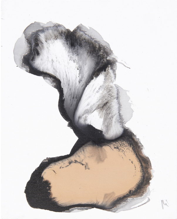
Mihisea / lienzo – 22 x 27 cm