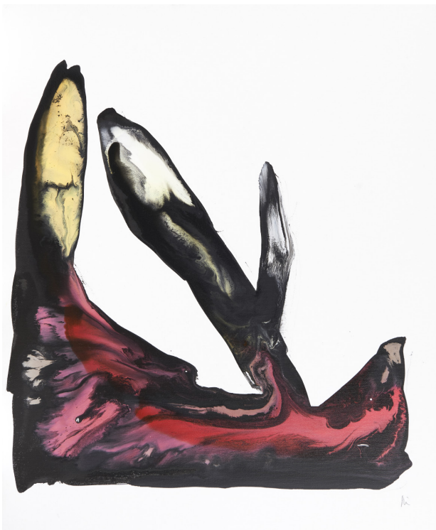
Mihisea / lienzo – 54 x 65 cm