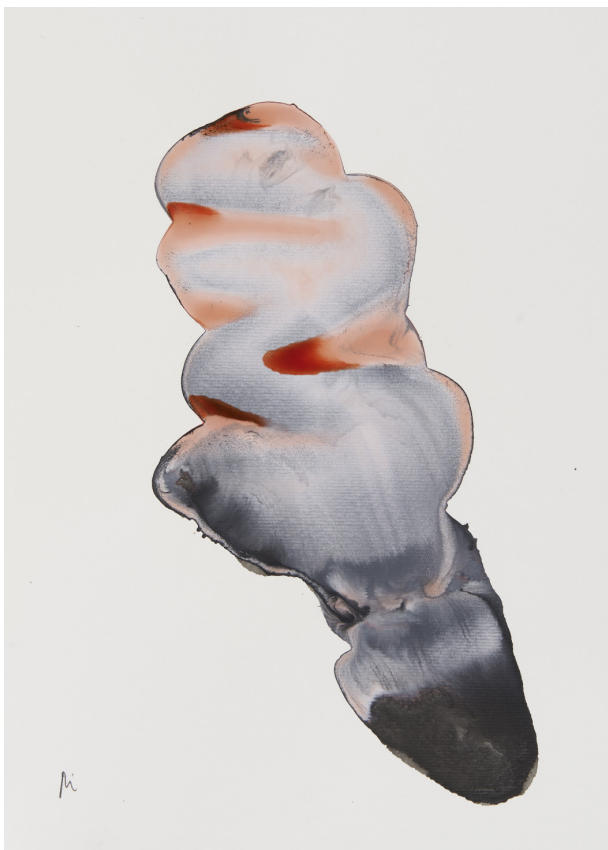
300 g-ko papera / papel 300 gr. – 30 x 42 cm