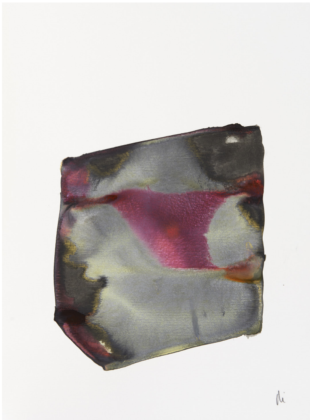
300 g-ko papera / papel 300 gr. – 30 x 42 cm