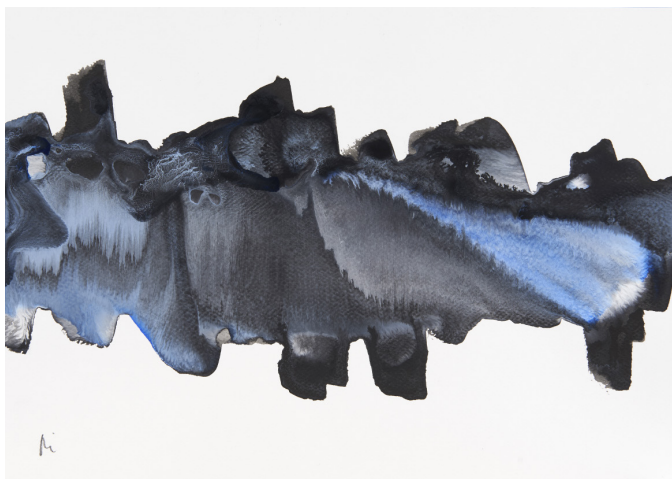
300 g-ko papera / papel 300 gr. – 30 x 42 cm