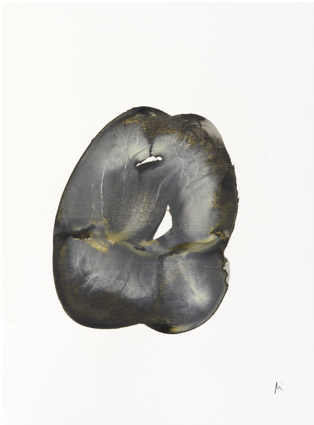
300 g-ko papera / papel 300 gr. – 30 x 42 cm