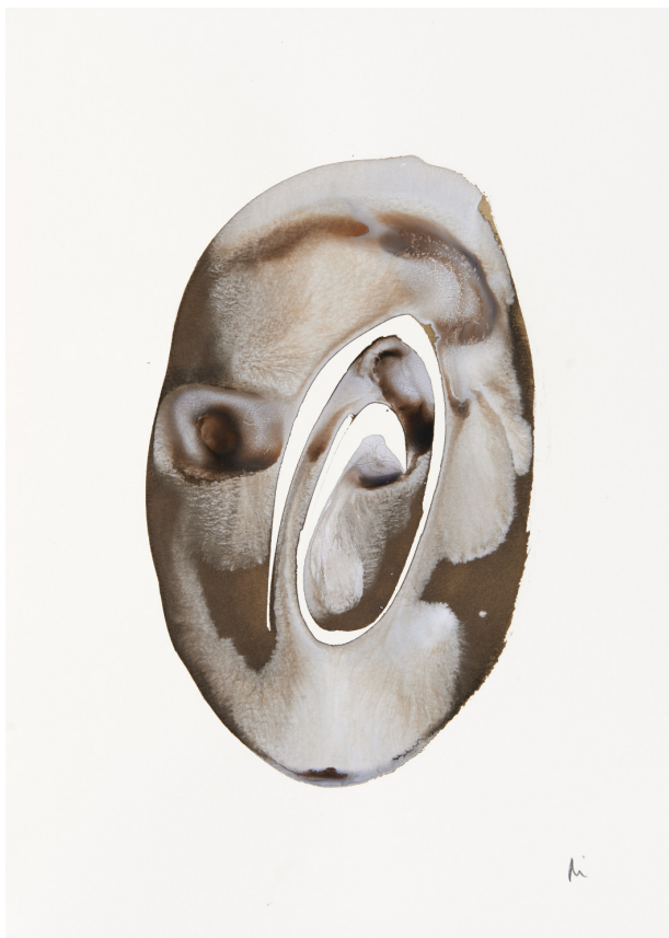
300 g-ko papera / papel 300 gr. – 30 x 42 cm