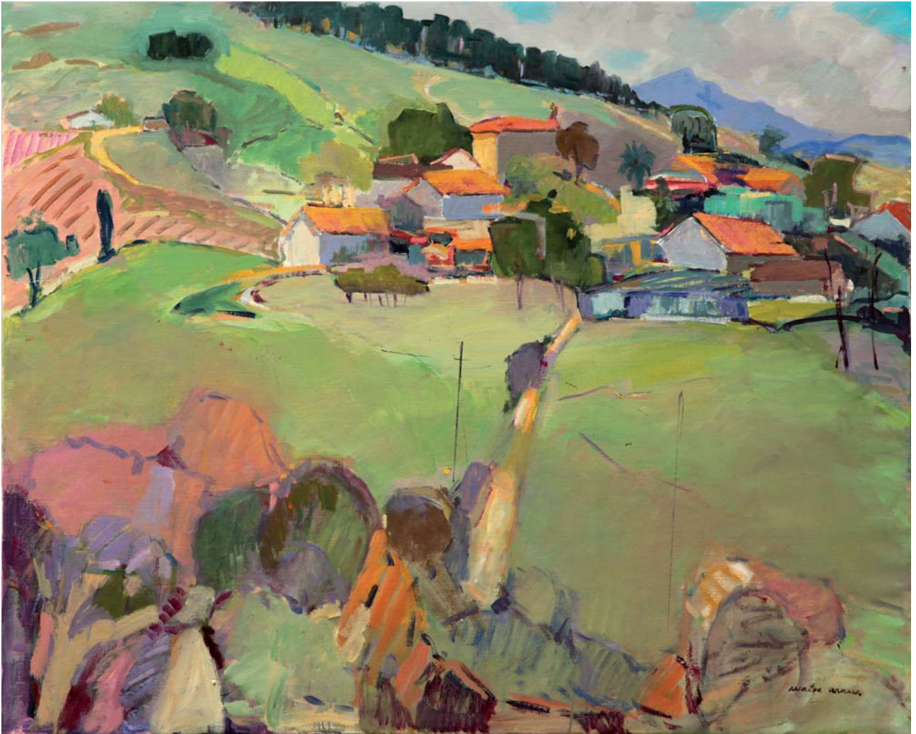
Azkizuko mahastiak Olíoa • Óleo 100 x 81 cm