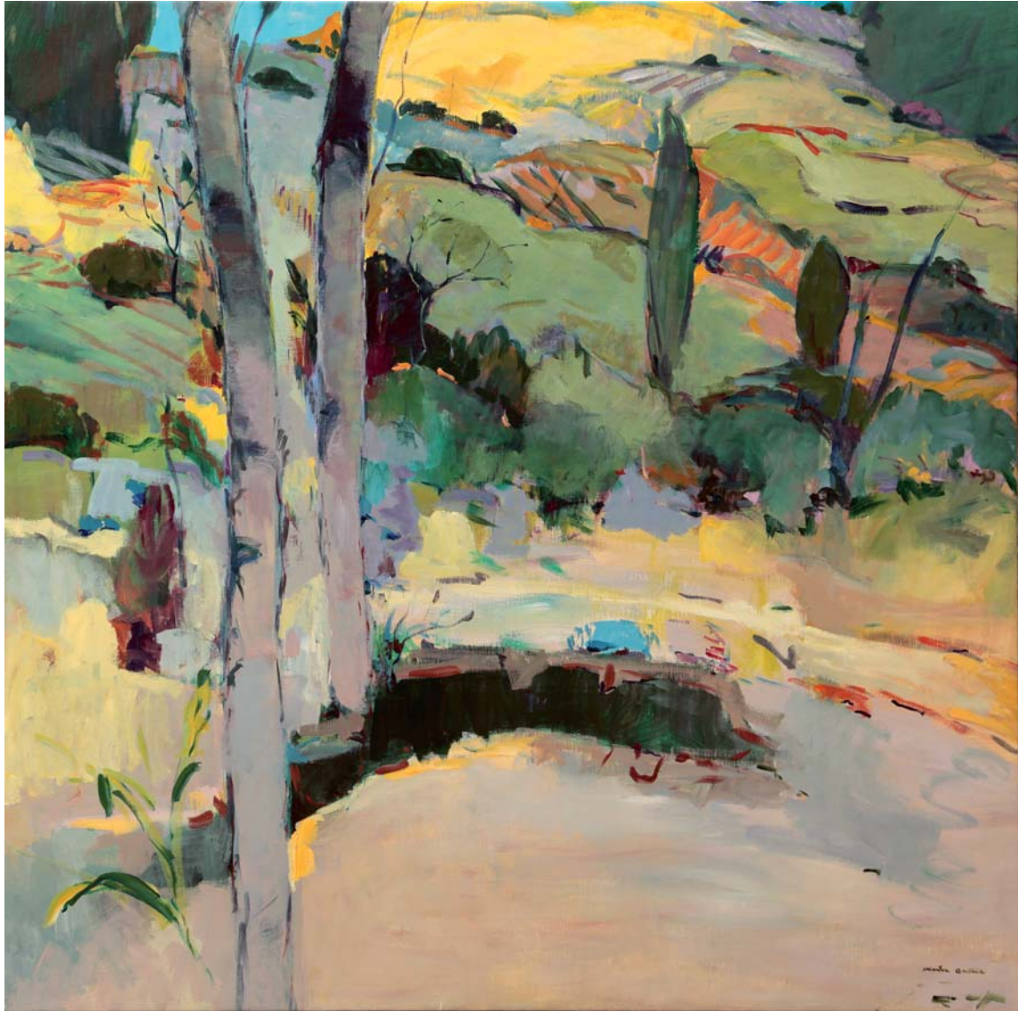
Orlegi sinfonia Akrilikoa • Acrílico 130 x 130 cm