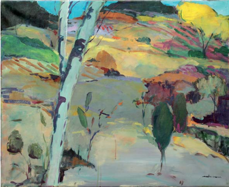
Urkiaren atzean Olíoa • Óleo 100 x 81 cm