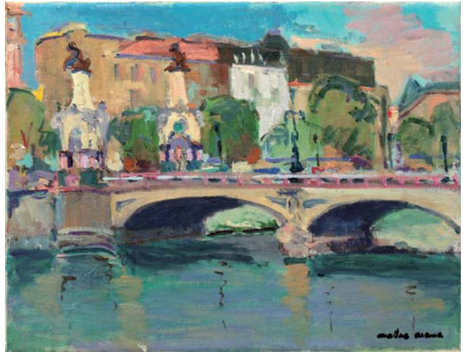
Maria Kristina zubia Olioa • Óleo 35 x 27 cm