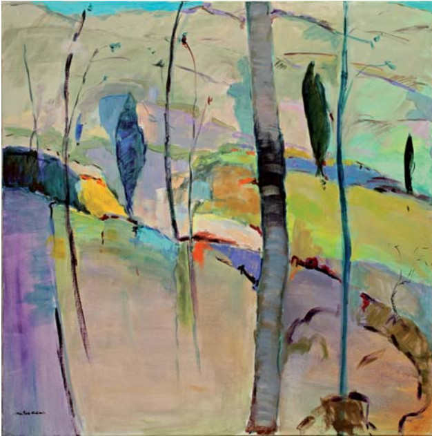
Amets Irudi I Akrilikoa • Acrilico 120 x 120 cm