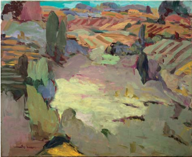
Kolare aldaketa Olioa • Óleo 73 x 60 cm