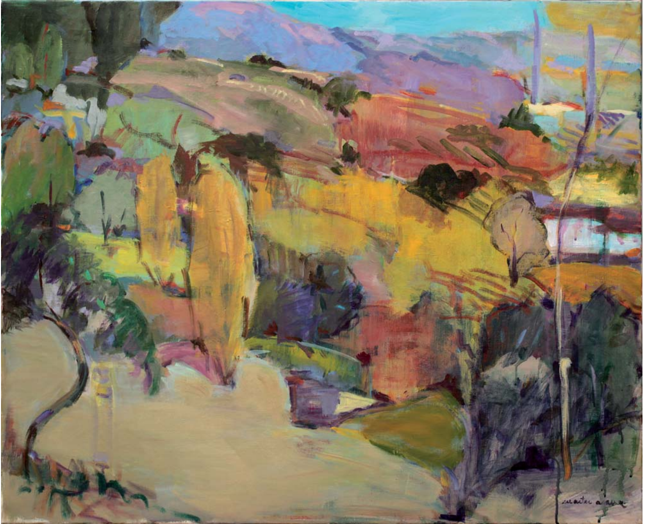
Bazter arrosak Teknika mistoa • Técnica mixta 100 x 81 cm