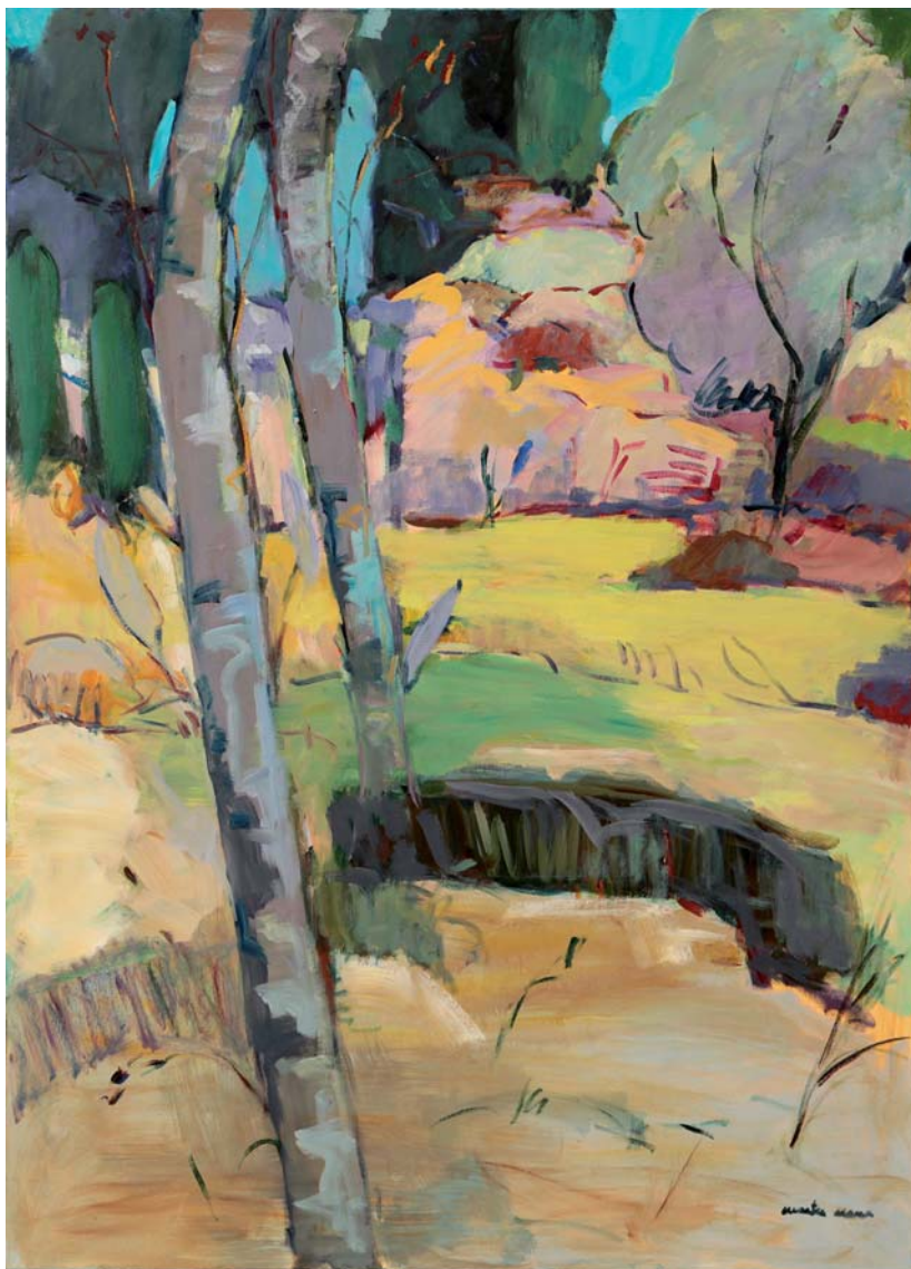
Ilunsentia Olívia • Óleo 100 x 81 cm