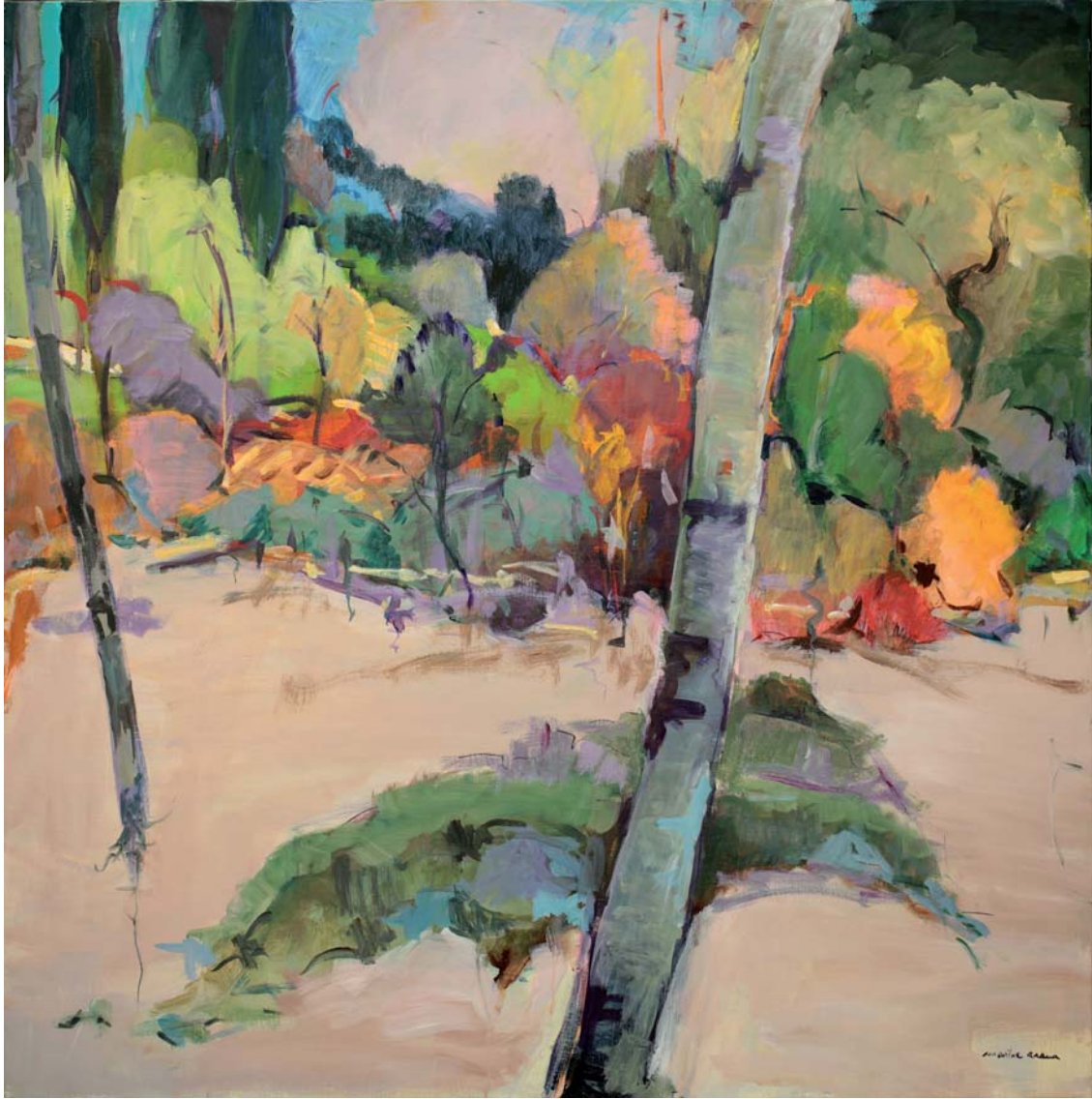
Ametz Irudi III Olíoa • Óleo 120 x 120 cm