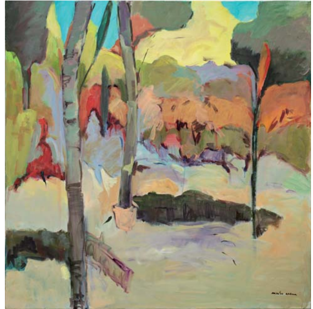
Amets Irudi II Akrilikoa • Acrilico 120 x 120 cm