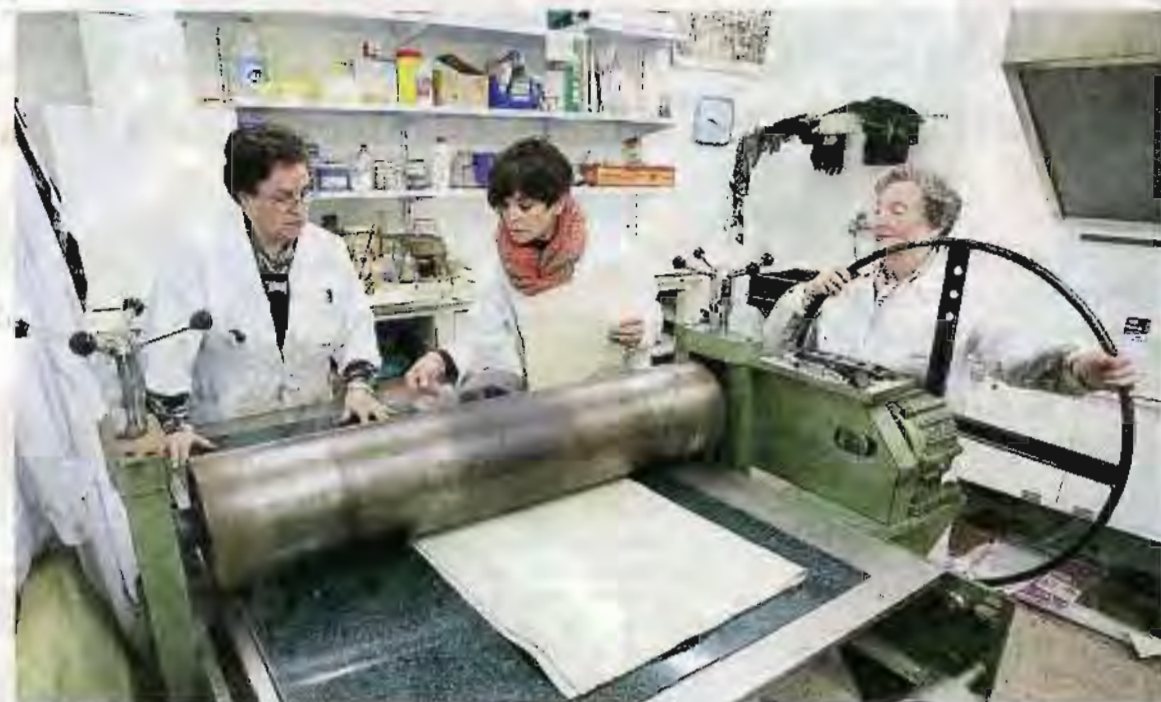
El tórculo de grabado se trasladó desde la antigua sede de San Telmo hasta Aldapeta.