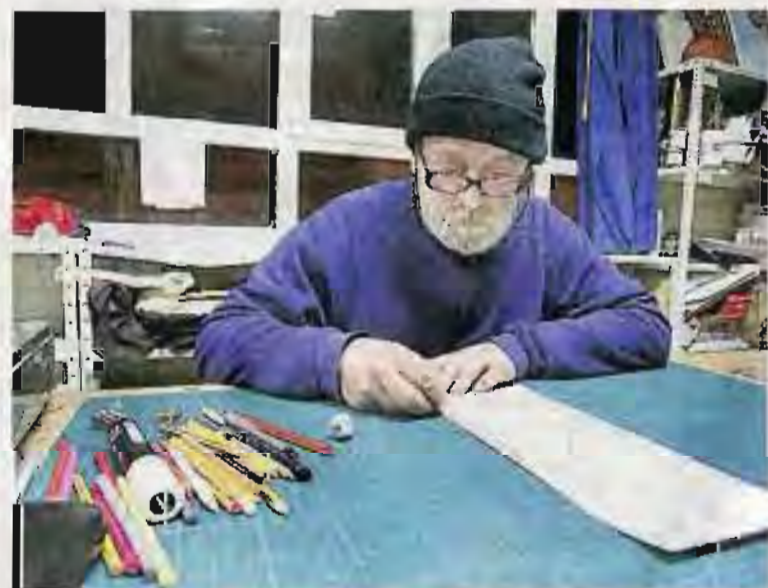
La libertad de la que gozan es una de las claves de la entidad.