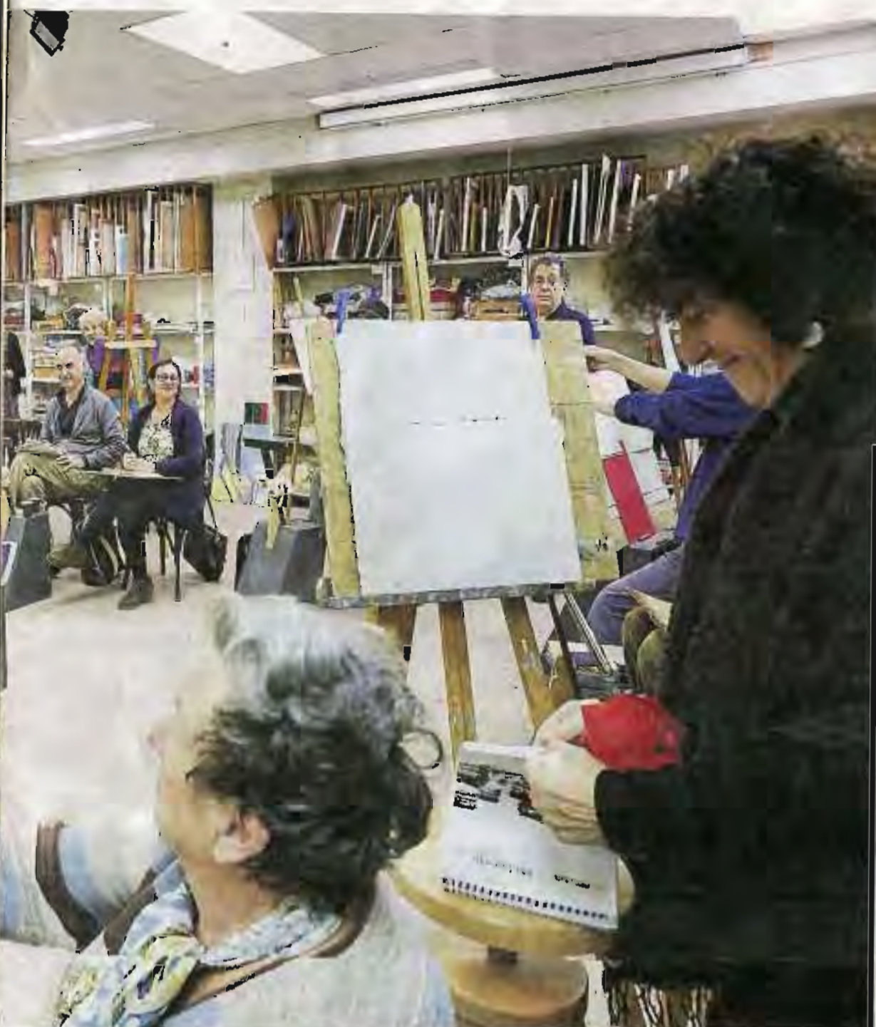
más demandadas de la Asociación, la del desnudo femenino. :: USOZ